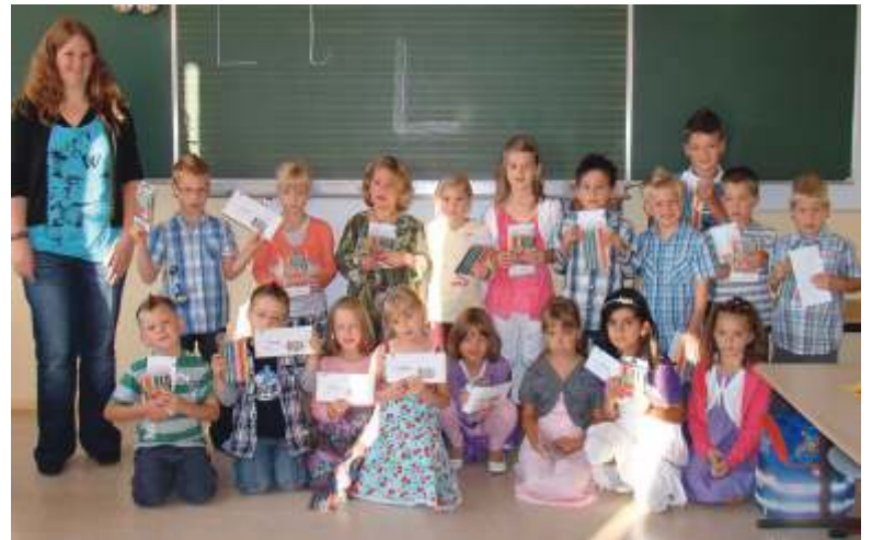
Freuten sich über den ersten Schultag und die Buntstifte von der VR Bank: die Erstklässler der Seementalschule in Ober-Seemen.

Der Schulanfang ist auch Anlass, über eine Zukunftsvorsorge für das Kind nachzudenken. Bei einer optimalen Planung kann man schon mit wenig Aufwand viel erreichen. Lassen Sie sich beraten, damit Sie Ihrem Kind die besten Voraussetzungen für den Start in die Zukunft geben können.