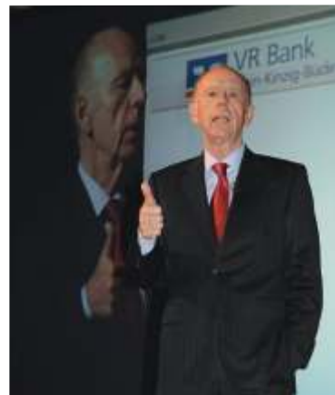
Renten-Experte Walter Riester in der Klosterberghalle in Langenselbold.

Walter Riester skizzierte die Entstehung seines Rentenmodells und erläuterte seine Absicht, eine Lösung für die Versorgungslücke, die sich aufgrund der demographischen Entwicklung bei vielen auf-tun werde, zu finden. Sein Anliegen als damaliger Bundesminister für Arbeit und Sozialordnung war es, Arbeiter, Angestellte oder Hartz-IV-Empfänger gleichermaßen von der Riester-Rente mit ihrer staatlichen Förderung profitieren zu lassen.