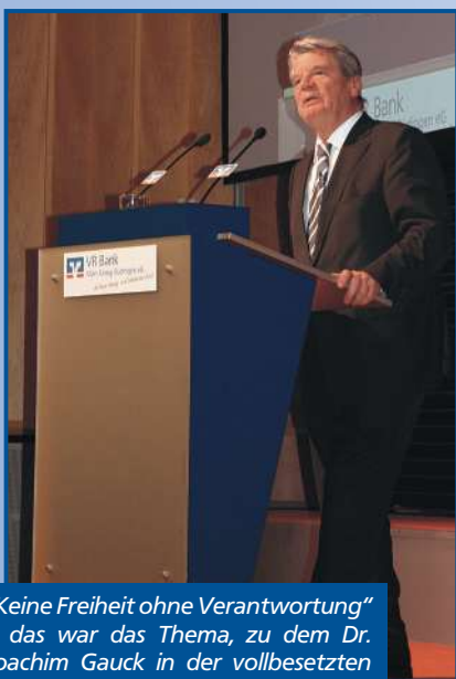
„Keine Freiheit ohne Verantwortung“ – das war das Thema, zu dem Dr. Joachim Gauck in der vollbesetzten Willi-Zinnkann-Halle referierte.

Eine etwas andere Trendnacht bot die VR Bank in diesem Jahr in der Willi-Zinnkann-Halle in Büdingen den rund 550 Gästen. Nur einen Gastreferent hatte die Bank eingeladen: Dr. Joachim Gauck, ehemaliger Leiter der Stasi-Unterlagen-Behörde und ehemaliger Kandidat auf das Amt des Bundespräsidenten.