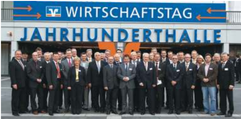
Firmenkunden der VR Bank Main-Kinzig-Büdingen eG besuchten den Wirtschaftstag 2010 in der Frankfurter Jahrhunderthalle.