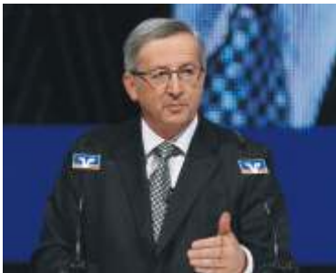
Wohl prominentester Redner des Wirtschaftstages: Jean-Claude Juncker, Premierminister von Luxemburg.

Knapp 3.000 Gäste – Unternehmer und Banker – kamen in die Jahrhunderthalle Frankfurt zum Wirtschaftstag der Volksbanken und Raiffeisenbanken, der 2010 unter dem Titel „Quo vadis, Deutschland? Wege zur Erneuerung“ stand. Auch Firmenkunden der VR Bank Main-Kinzig-Büdingen eG waren dabei und erlebten Vorträge und Diskussionsrunden mit hochkarätigen Gästen.