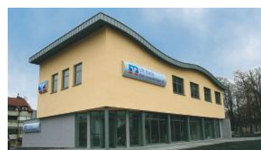
Die neue VR Bank in der Thermalstraße.

war dann die gesamte Bevölkerung eingeladen, beim Tag der offenen Tür in vorweihnachtlicher Atmosphäre mitzufeiern.