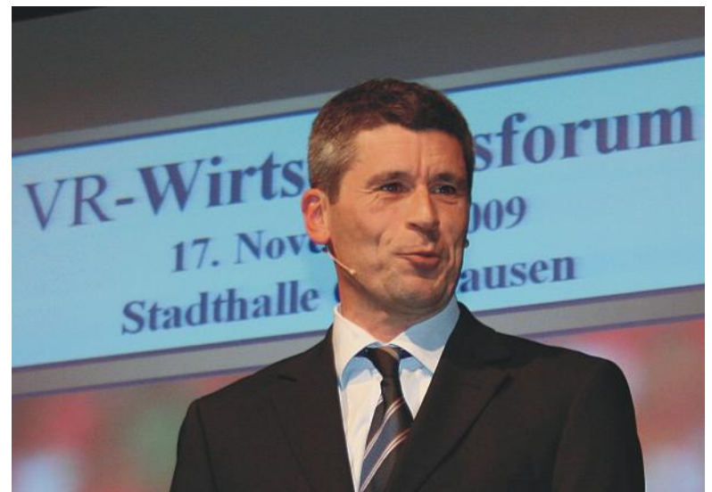
Begeisterte die Gäste des VR-Wirtschaftsforums – meist Unternehmer aus der Region – in der Stadthalle Gelnhausen: zweifacher Weltschiedsrichter und Top-Referent Dr. Markus Merk.

Angereichert mit Witz und dem einen oder anderen verbalen Querpass begeisterte der promovierte Zahnarzt seine Zuhörer. Als Beweis