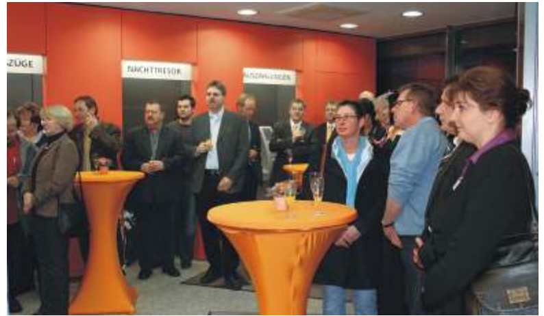
Zahlreiche Gäste kamen zur Eröffnungsfeier in die Geschäftsstelle Ranstadt.

„Viele Einrichtungsgegenstände wie Deckenleuchten, Tische und Stühle konnten wir wieder verwenden und in ein harmonisches Gesamtbild integrieren“ erklärte Architekt