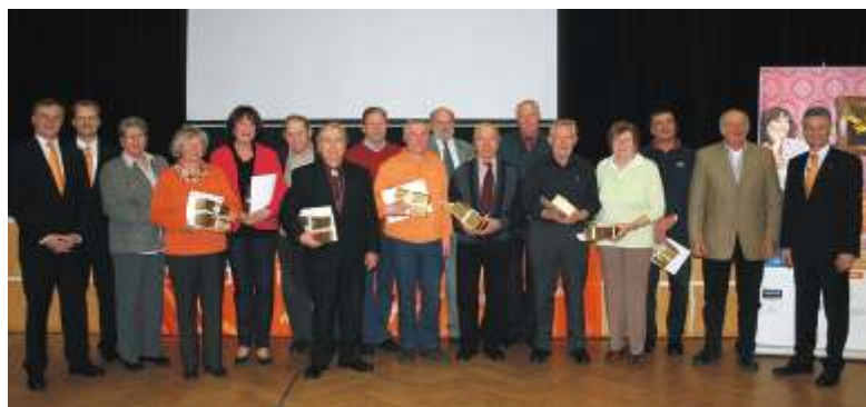
Auf jeder Mitgliederversammlung wurden – wie hier in Büdingen – langjährige Mitglieder geehrt.

Wegen dem großen Interesse an den Mitgliederversammlungen, wird die Veranstaltungsreihe in neuer Form ab 2011 auch auf den Bereich Main-Kinzig ausgeweitet.