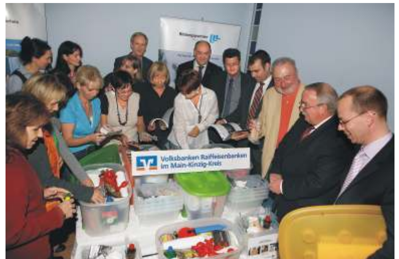
Erzieherinnen und die „Offiziellen“ freuten sich gleichermaßen über die Chemie-Experimentierkästen (hier bei der Übergabe in Langenselbold).

Um diese naturwissenschaftlichen Phänomene zu verstehen und vor