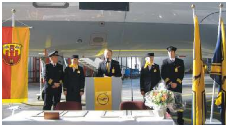
In einem feierlichen Rahmen wurde der Airbus A 320 getauft.

Stundenkilometern künftig bis zu 156 Passagiere u. a. nach London, Mailand, Oslo oder Madrid.