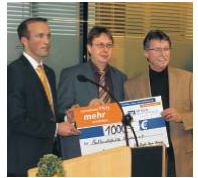
Die Nachbarschaftshilfe Ranstadt freut sich über eine 1.000-Euro-Spende.