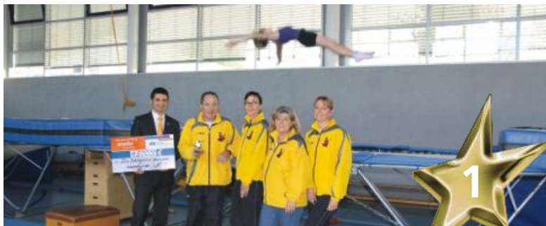
Der Dauerner Trampolin Verein „Die Kängurus“ belegten mit ihrem sozialen Projekt Platz 1 - zur Freude aller Mitglieder.

Projekte waren im Laufe dieses Jahres eingereicht worden. Die drei Besten unter den Einsendungen zu bestimmen, war nicht einfach.