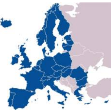
Die aktuellen SEPA-Mitgliedsstaaten im Überblick