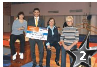
Mehr Bewegung in Kindergärten schafft der Turnverein 1906 e.V. Wächtersbach.

Wächtersbach mit seinem Projekt „Mehr Bewegung in den Kindergärten“. In Kooperation mit dem Evangelischen Kindergarten Wächtersbach und mit finanzieller Unterstützung durch die Sportjugend Hessen veranstaltet der Turnverein sogenannte „Bewegungstage“ in der Turnhalle. An diesen Tagen wird die Gesundheit der Kindergartenkinder durch verschiedene Bewegungsangebote gefördert. Das Projekt zielt darauf ab, Spaß an Bewegung zu wecken und die