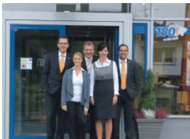
Das Kundenserviceteam der Filiale in Romsthal freut sich über die neu gestalteten Räumlichkeiten.

Nach weniger als vier Wochen Bauzeit präsentierten sich die Räumlichkeiten in Roßdorf und