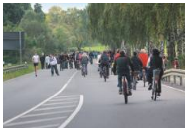
Der autofreie Feiertag lockte Spaziergänger, Skater und Radfahrer an.

Am Sonntag, 30. September, fand in Erlensee der alljährliche verkaufsoffene Sonntag statt. Die VR Bank Main-Kinzig-Büdingen eG präsentierte sich im Zeichen ihres 150-jährigen Jubiläums am Erlenseer Sonntag: Bei einem Glas Sekt konnte sich jeder eingehend über die Tradition und Zukunft der VR Bank informieren. Zudem konnten sich die Besucher bei einer Fotoaktion ablichten lassen und ihr ganz persönliches Computer-Mauspad mit nach Hause nehmen. Im Außenbereich sorgte die große VR-