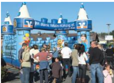
Großer Andrang herrschte beim Erlenseer Sonntag an der Hüpfburg.

Zwei schöne Veranstaltungen mit vielen glücklichen Besuchern und zufriedenen Organisatoren.