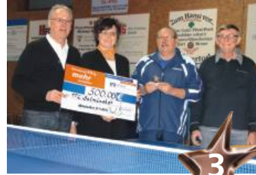
Mit der Tischtennis AG auf Platz 3: Der TTC Salmünster 1950 e. V. erhielt den bronzefarbenen Stern.

Koordinationsfähigkeit der kleinen Sportler zu verbessern.