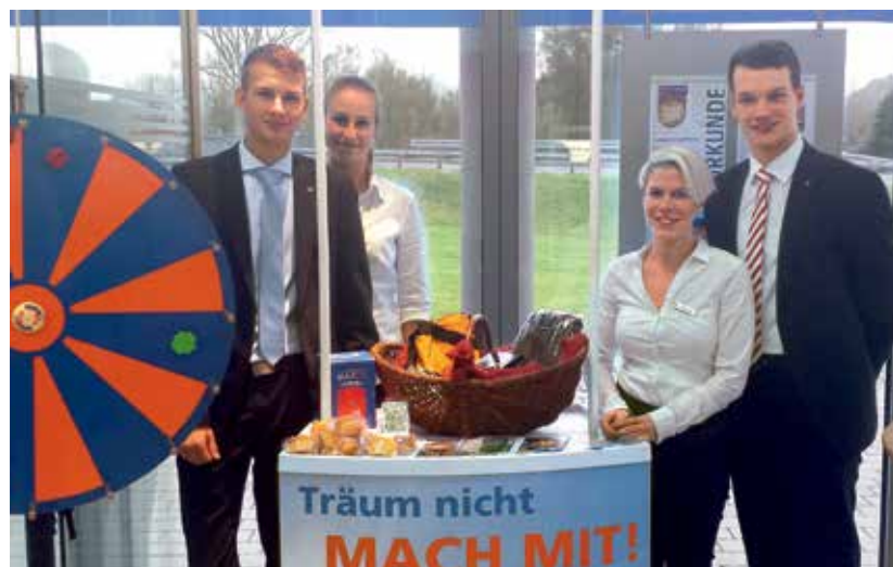
Die Auszubildenden der VR Bank Main-Kinzig-Büdingen eG unterstützen erfolgreich die Aktion „Gewinnsparelose“

Mehr hierzu unter www.vrbank-mkb.de/gewinnsparen