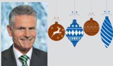
Liebe Leserinnen, liebe Leser,

fast 57.000 Menschen sind mehr als nur Kunden, sie sind Mitglieder unserer Bank. Für diese Identifikation mit uns bedanke ich mich sehr. Sinn unseres Geschäftsmodells ist es, der realen heimischen Wirtschaft zu dienen. Dabei leben wir unsere Werte: Vertrauen, Glaubwürdigkeit und Regionalität. Wir sichern Investitionsvorhaben, sowie den Vermögensaufbau für unsere Mitglieder und Kunden. Aus unserem Geschäftserfolg geben wir einen Teil als Spenden an gemeinnützige Vereine und Institutionen zurück. Näheres dazu und wie auch Sie Ihrer Geschäftsbeziehung mit uns das „Sahnehäubchen“ aufsetzen können, erfahren Sie auf den folgenden beiden Seiten.