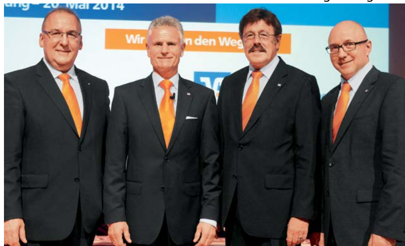
Der Vorstand der VR Bank Main-Kinzig-Büdingen eG bei der Vertreterversammlung.