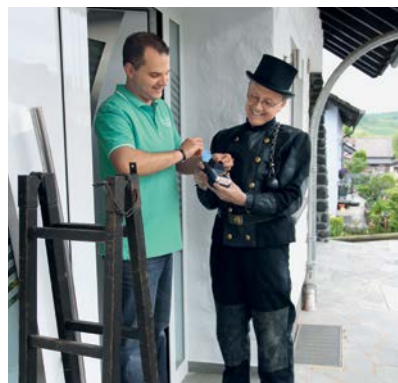
Dank dem EC Cash Gerät erhält der Firmenkunde sein Geld schnell und sicher.

Die Firmen- und Vereinskunden werden von den eBanking-Spezialisten individuell beraten. Bei Unternehmen und Vereinen fallen i. d. R. große Mengen an Transaktionen an. In einer Beratung per Telefon, in der Geschäftsstelle oder vor Ort, wird gemeinsam mit dem Kunden die optimale Lösung erarbeitet. Zu der umfangreichen Palette gehören u.a. Softwareprodukte, zeitgemäße Sicherheitsverfahren und Bezahlterminals.