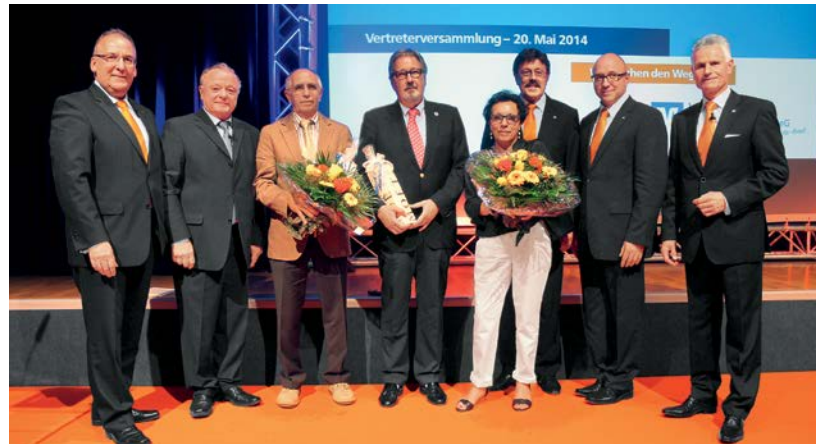
Ehrung und Danksagung der ausgeschiedenen Aufsichtsratsmitglieder.

Mit Trends und Entwicklungen am Finanzmarkt beendete Hof den Be-