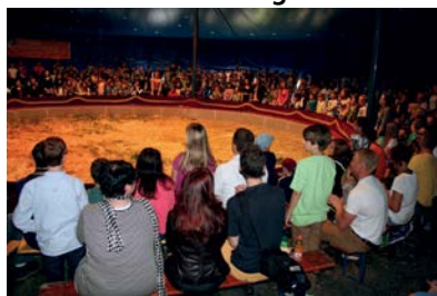
Manege frei für die Sieger des Malwettbewerbs der VR Bank Main-Kinzig-Büdingen eG.

„Hereinspaziert“, so schallte es durch das Zirkuszelt in Düdelnheim am Festplatz. Dieses wurde extra für die Siegerparty des Malwettbewerbs von der VR Bank Main-Kinzig-Büdingen eG gemietet. Fast 450 geladene Gäste, die Sieger des Malwettbewerbs und deren Eltern und Geschwister, verfolgten mit Spannung die Preisübergabe und die zirkusischen Vorführungen.