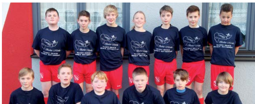
Die Jugendabteilung des TSV 08 Kassel e. V. wird durch die V.I.P.-Karten unterstützt.

Die Inhalte dieses Artikels wurden der VR Bank Main-Kinzig-Büdingen eG von dem Verein zur Veröffentlichung überlassen. Für die Richtigkeit, Vollständigkeit und Aktualität der Inhalte können wir keine Gewähr übernehmen.