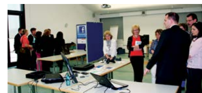
Die Besucher auf der Online-Hausmesse.

Um die Belegschaft über aktuelle Trends im Haus zu informieren, veranstaltete die VR Bank Main-Kinzig-Büdingen eG erstmals eine interne Online-Messe. Die Besucher informierten sich über die Entwicklungen im Be-