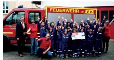
Die Jugendabteilung der FFW Aulendiebach freut sich über das Preisgeld.

Des Weiteren erhielten Vereine, die 50 Stimmen und mehr gesammelt hatten, eine Spende von 100,- Euro: Verschwisterungsverein Gedern/Columbia, Theatergruppe „Die Mühlengeister“, Spielmanns- und Fanfarenzug Ronneburg, G.V. „HARMONIE“ Bernbach 1879, Reit- und Fahrverein Ronneburger Hügelland, Schützenverein Düdelnheim, Bushido Erlensee, TV 1859 Nidda, Spvgg. 1910 Langenselbold, Schwul-Hilfe, FFW Ortenberg Bergheim, Förderverein der Kita Wichteltal, FFW Burkhardts.