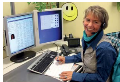
„Ein Lächeln kann man hören!“ - nach diesem Motto arbeitet das KSC.

Die vielfältigen Serviceleistungen des KSC werden durch die vielen Kontaktmöglichkeiten abgerundet. Kunden erreichen die Mitarbeiter des KSC direkt unter der Telefonnummer 06042/888-188. Des Weiteren kann der Kunde einen Rückrufwunsch über