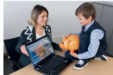
Die Online-Filiale ist kinderleicht - die VR Bank hilft Ihnen bei Fragen gerne weiter.

bietet Online-Abschlussstrecken für folgende Produkte an: VR-Tagesgeld 24, VR-Girokonto 24, VR-Sparbrief 24 sowie VR-Wachstumssparen 24. Zudem haben Kunden die Möglichkeit im eBanking mit dem Finanzmanager ihre Finanzen in einem digitalen Haushaltsbuch zu verwalten.