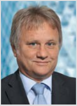
Liebe Leserinnen, lieber Leser,

jedes zweite Mitglied und Kunde nutzt nicht nur das Angebot in den Geschäftsstellen, sondern hat sich zusätzlich für unsere „Online-Filiale“ oder unser KundenServiceCenter entschieden. Danke dafür!