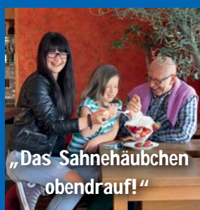
„Das Sahnehäubchen obendrauf!“

Früh abschließen lohnt sich - lassen Sie sich bei Ihrer VR Bank Main-Kinzig-Büdingen eG beraten. Auch eine Kombination mit dem R+V-Pflegekonzept ist möglich.