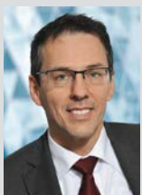
Liebe Leserinnen, lieber Leser,

das eigene Haus, eine schöne Urlaubsreise, ein neues Fahrrad, eine neue Waschmaschine, ... die Wünsche und Träume unserer Kunden sind so vielfältig und individuell wie die Menschen selbst. Der VR-FinanzPlan hilft Ihnen Ihre Pläne zu strukturieren und realistisch in die Tat umzusetzen. Hierbei unterstützen und beraten Sie unsere Mitarbeiterinnen und Mitarbeiter stets umfassend, verständlich und auf Augenhöhe. Vom Schüler über den Auszubildenden, bis hin zum Berufseinsteiger, Familiengründer oder Renter - der VR-FinanzPlan hilft jedem Kunden in jeder Lebensphase.