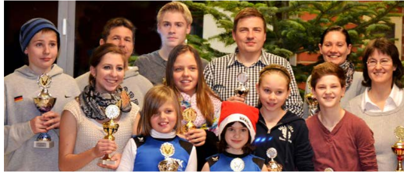
Die Leichtathleten des Vereins freuten sich Ende 2013 über zahlreiche Trophäen.

Aufgrund großer Nachfrage wurde in jüngster Zeit der „Reha-Sport“ verstärkt ausgebaut. Trainerinnen in diesem Bereich sind speziell geschult und lizenziert. Außerdem bietet der VfL während der Sommerferien ein kostenloses Training zum Erreichen des Sportabzeichens an. Über 100 Abzeichen wurden jährlich verliehen. Und immer im Januar organisiert der VfL den „Dreikönigslauf“, ein Volkslauf im Rahmen des „Oberhessen-Cups“.