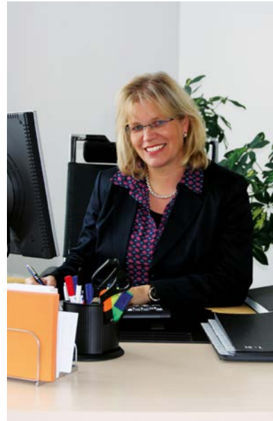
„Als Mitarbeiterin in einem großen Konzern weiss ich ein Mitspracherecht sehr zu schätzen.“

Der Vorstand der VR Bank Main-Kinzig-Büdingen eG leitet die Genossenschaft in eigener Verantwortung. Er gibt über die Geschäftstätigkeit und die Geschäftsentwicklung regelmäßig Rechenschaftsberichte gegenüber dem Aufsichtsrat oder seinen Aus-