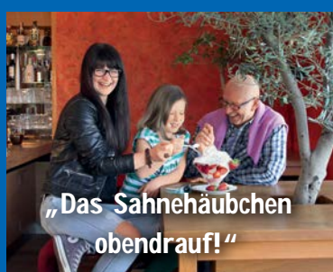
„Das Sahnehäubchen obendrauf!“

Jeder Mensch hat etwas, das ihn antreibt.