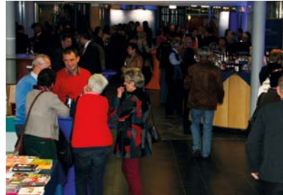
An den vielfältigen Messeständen im Foyer herrschte vor und nach den Vorträgen reger Andrang.

über 50 noch fit halten kann, erfuhren die Zuhörer von ihm aus erster Hand. Als Bundestagsabgeordneter beleuchtete er das Thema „Alter“ auch aus Sicht der Politik. „Es muss generationenübergreifend mehr auf Bewegung geachtet werden“, lautete die zentrale Botschaft des ehemaligen Olympioniken.