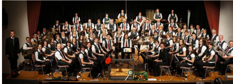
Das große Orchester des Musikvereins 1964 Oberndorf kann auf eine lange Geschichte mit vielen musikalischen Erfolgen und Fortschritten zurückblicken.

Die Inhalte dieses Artikels wurden der VR Bank Main-Kinzig-Büdingen eG von dem Verein zur Veröffentlichung überlassen. Für die Richtigkeit, Vollständigkeit und Aktualität der Inhalte können wir keine Gewähr übernehmen.