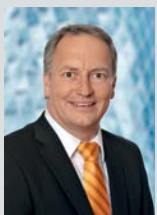
Liebe Leserinnen, lieber Leser,

das Jahresende naht und damit auch die Zeit, eine Bilanz der vergangenen zwölf Monate zu ziehen.